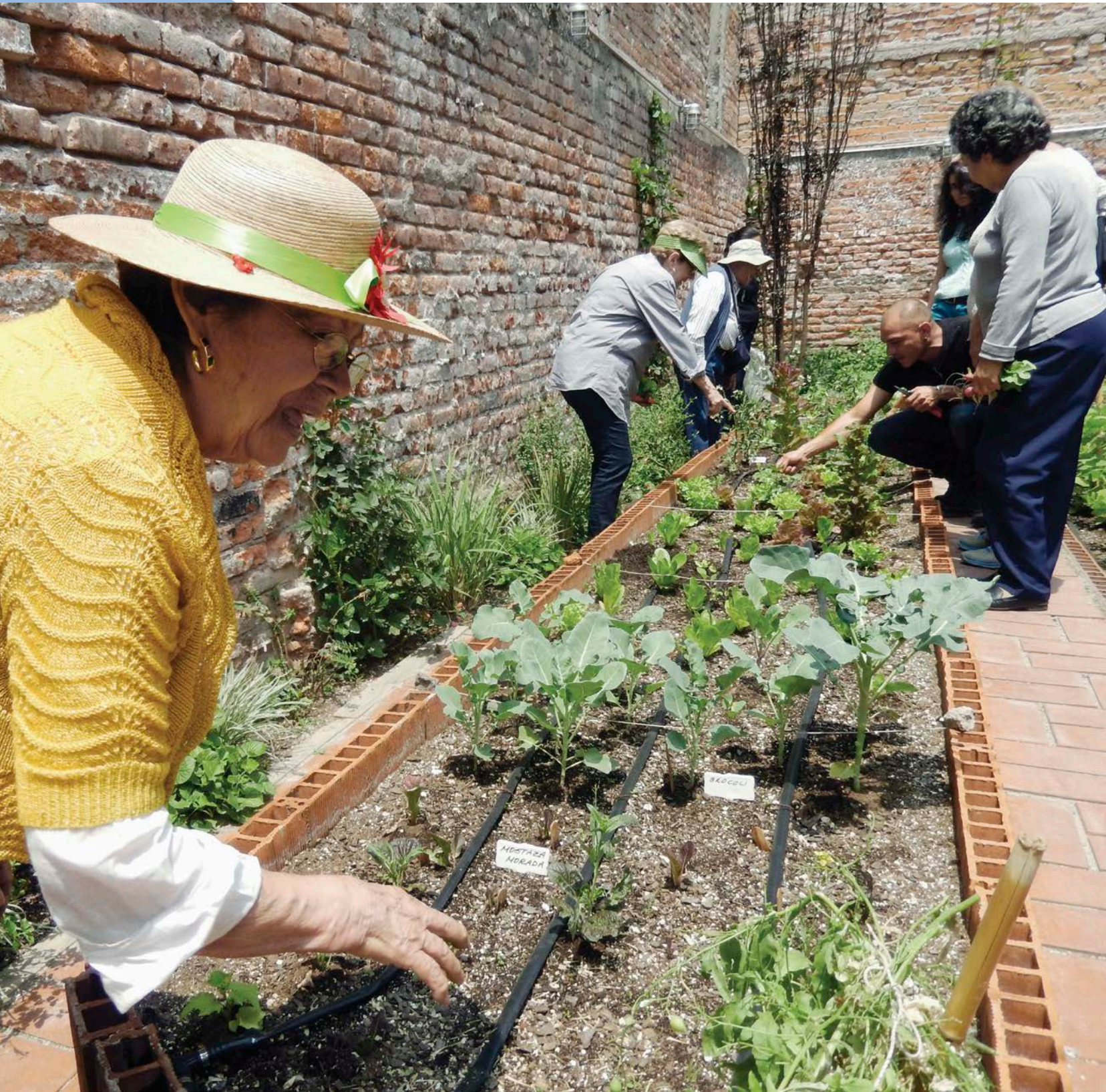
Ferme urbaine/Urban Farm.